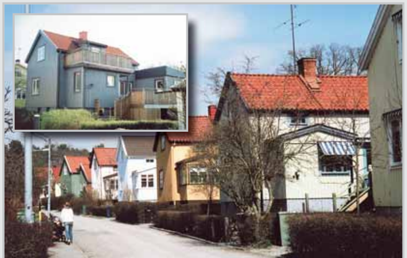
Norra Ängby. En grupp 1 1/2-planshus med de typiska ursprungliga verandorna. På lilla infällda bilden visas ett exempel på hur flera ändringar, kulör, fönstersättning, tillbyggnadsformer och räcken som inte hör hemma i denna byggnadstradition, medför att husets karaktärsdrag inte längre kan avläsas.

Det har visat sig att de tillbyggnadsalternativ som angavs i miljöprogrammet inte var tillräckliga för de boendes behov. Många har börjat med att förstora och förhöja verandan, därefter har vinkeln som blev kvar fylls ut med rumsyta och en entrétillbyggnad med plats för wc har placerats på lämpligt ställe. I ovanvåningarna har breda takkupor byggts för att inrymma badrum. När dessa åtgärder inte har räckt har man föreslagit tillbyggnader, fortfarande mot trädgården, men i nästan hela husets bredd. Dessa tillägg har oftast kunnat tillstyrkas även av kulturmiljövårdande myndighet.